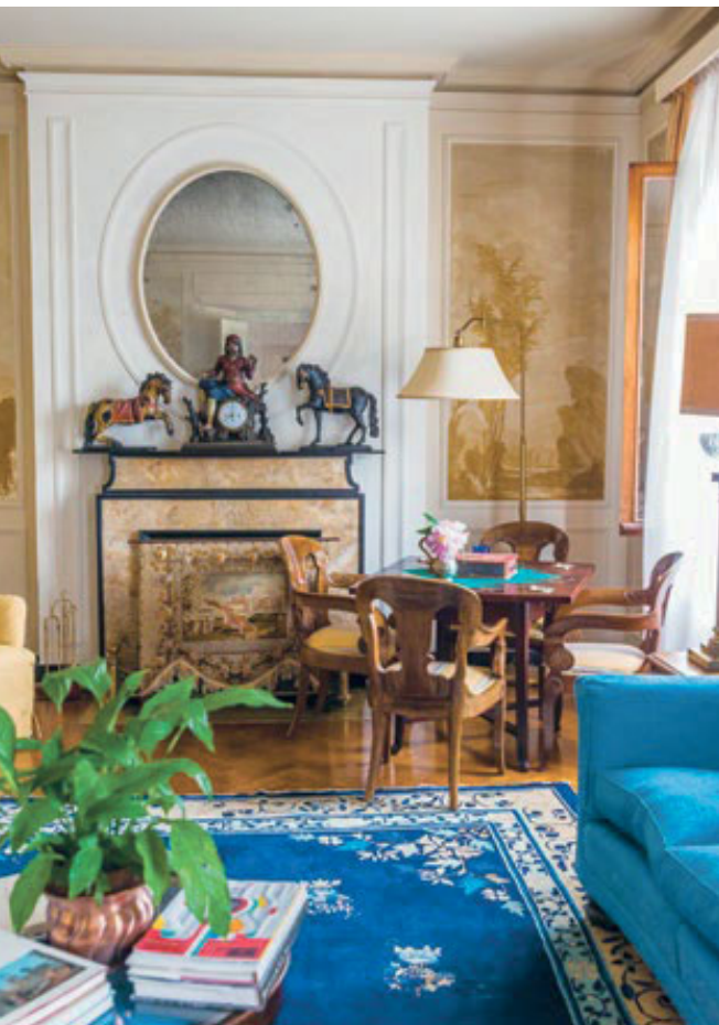
Qui sopra, alcuni ambienti di Villa Barberina , l'alloggio della famosa azienda Nino Franco. Nella pagina accanto, un momento degustazione al Duca di Dolle .